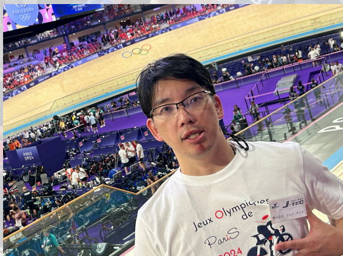
競技会場にて記念写真